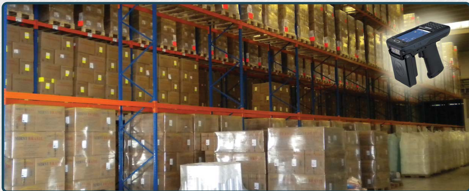
Solución RFID que asegura el monitoreo